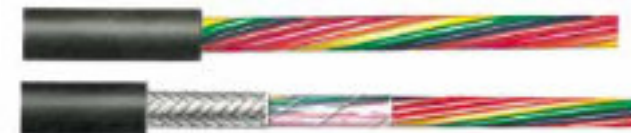
6 x 0,09 mm 2 (7 x 0,127) AWG 28 geschirmt - UL2464